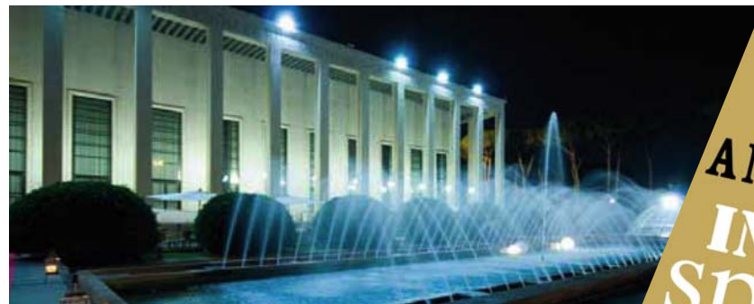
SALONE DELLE FONTANE via Ciro II Grande 10, ROMA