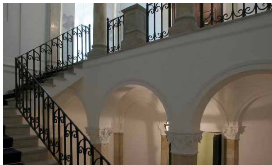
ROMA EVENTI via Alibert 5A, ROMA