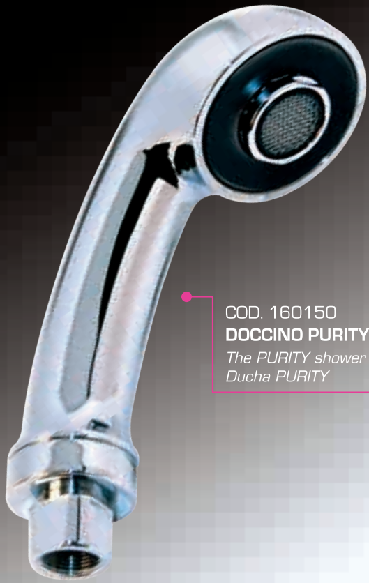
COD. 160150 DOCCINO PURITY The PURITY shower jet Ducha PURITY