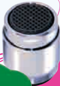
COD. 160152 ADATTATORE DOCCINO PURITY The Purity shower jet adapter El adaptador del la ducha Purity