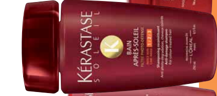
BAIN APRÈS-SOLEIL CAPELLI COLORATI DETERSIONE