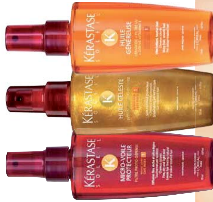
MICRO-VOILE PROTECTEUR EFFETTO INVISIBILE PROTEZIONE

IDEALE PER LE DONNE CON CAPELLI LEGGERMENTE SENSIBILIZZATI