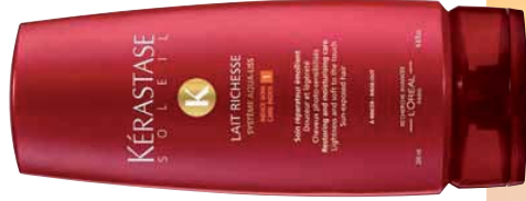
LAIT RICHESSE TRATTAMENTO